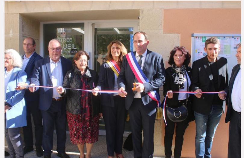
Coupure du ruban