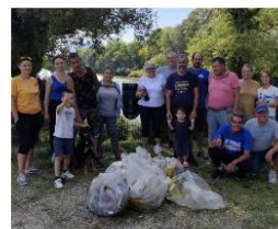
Ici pendant la collecte de déchets.

La fédération ardiennaise AAPPMA vient d'adhérer au mouvement international World Cleanup Day, inscrit au calendrier officiel des journées mondiales de l'ONU. Deux cents pays se mobilisent pour nettoyer la planète. Ainsi, une grande journée de ramassage des déchets a eu lieu le 20 septembre. Au total, 34 AAPPMA se sont mobilisées sur 34 points de collecte dans la région ardiennaise. L'AAPPMA La Gaule cruassienne en a fait partie. Les pêcheurs cruassiens ont ramassé plus de 100 kg de déchets divers.