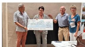
Lors de la remise du chèque de soutien.

L'association a la chance d'avoir six animateurs diplômés bénévoles qui font découvrir la région, sa nature et son patrimoine avec beaucoup de