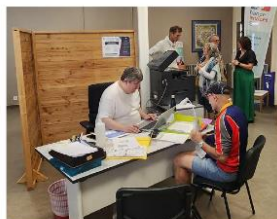
Les nouveaux bureaux.

Ces agents font aussi le relais avec les partenaires locaux (uniquement sur rendez-vous) que sont territoire Zéro chômeur, le centre d'information des femmes et familles, France Victimes, l'ac-