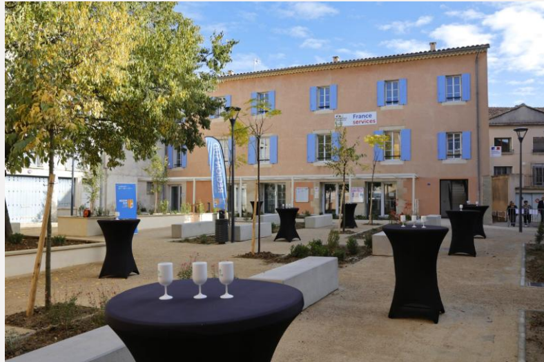
Lieu prêt à accueillir